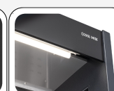
Lampe LED interne