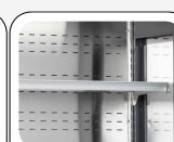
Étagères en acier reposant sur des blocs ancrés aux épaules