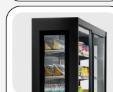
Parois latérales panoramiques